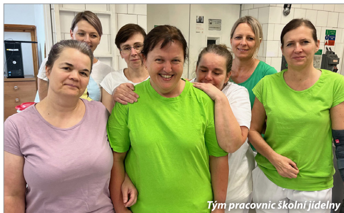
Tým pracovníků školní jídelny

a rozšířenou otevírací dobou. Rozpočet 35 mil. Kč z 80 % pokryje dotace. Co se týče dotací, je to jeden z našich největších úspěchů v historii a pro Sázavu doslova vysvobození!