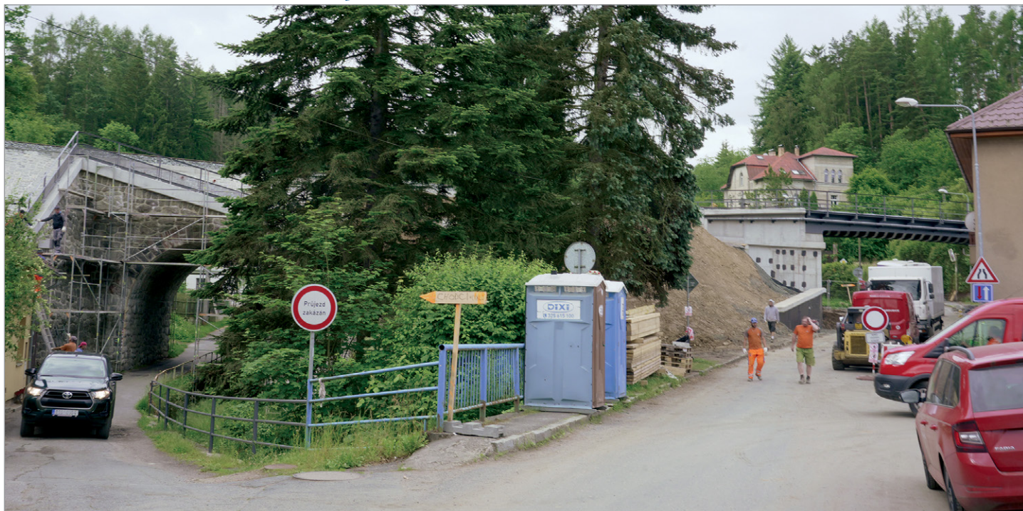
Finišují stavební práce na viaduktech a brzy dojde k otevření trati a Benešovské ulice.