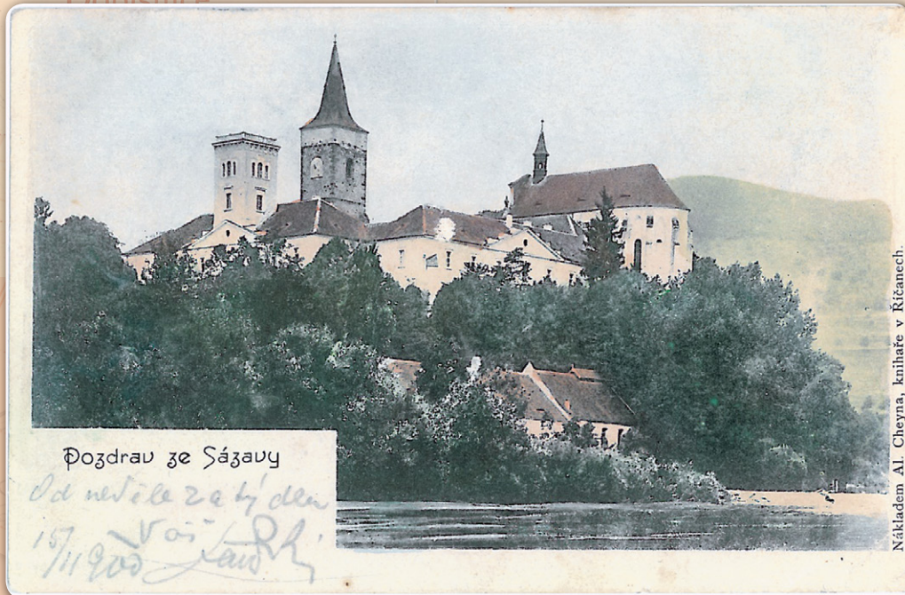
Nákładem Al. Cheyna, knižkače v Říčanech.

Od zámeckého jezu je bývalý klášter, později zámek, nejfotogenictější. Stovky podobných pohledů pouze mapují devastaci mlýna a pivovaru. Takových fotogenických míst je v Sázavě ještě několik, např. Na vyhlídce, z altánku, z klášterního nádvoří, na kterých se dá velmi přesně zachytit rozvoj města nebo naopak staletá neměnnost.