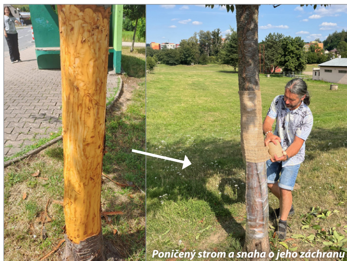
Poničený strom a snaha o jeho záchranu