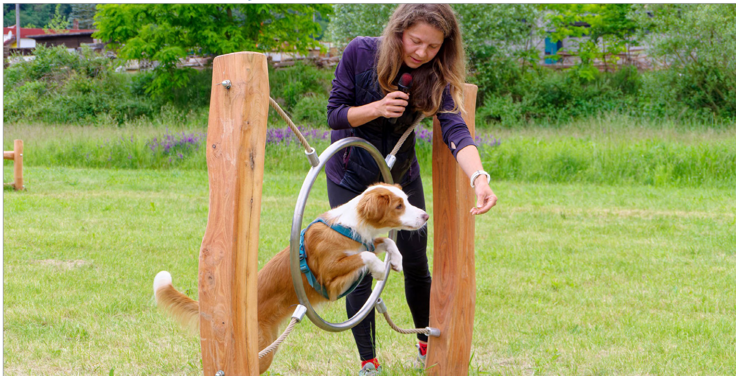
Na louce za atletickým stadionem se v květnu otevřelo psí hřiště. Více informací na straně 2.