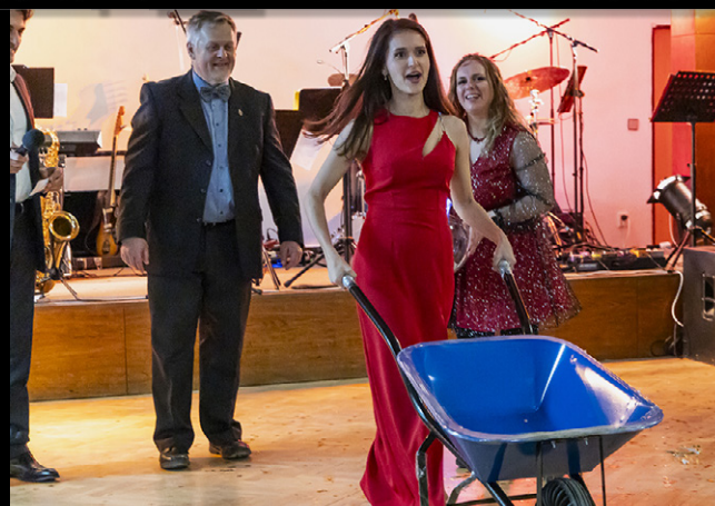
- ŠŤASTNÁ VÝHERKYŇE JEDNÉ Z CEN