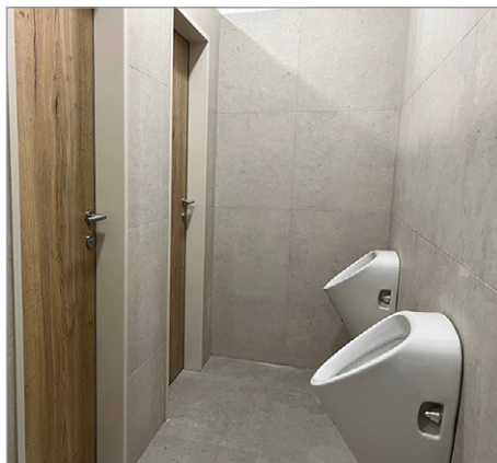
▲ WC v sokolovně – muži

pokračování ze strany 1 – Doba záchodová – fotografie ke článku