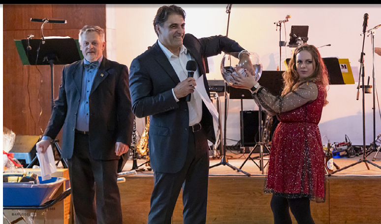
- SLOSOVÁNÍ VSTUPENEK