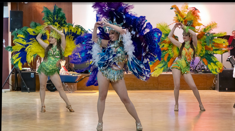
- DO SÁZAVY SE DOSTALA I BRAZILSKÁ SAMBA