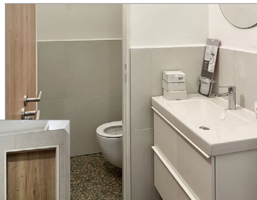
▲ WC v družině