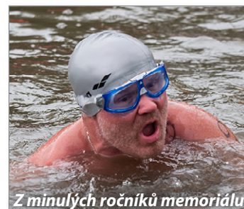
Z minulých ročníků memoriálu