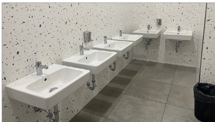
◀ Umyvadla a WC v základní škole