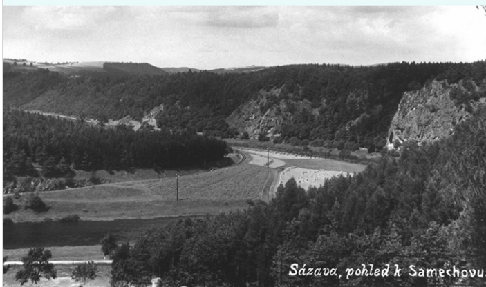
Sázava, pohled k Saměchovu.