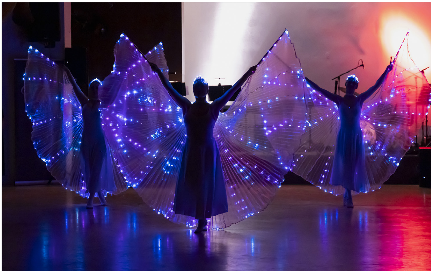
Vystoupení umělecké skupiny FANTASTIC Art na reprezentačním městském plese ve společenském domě.