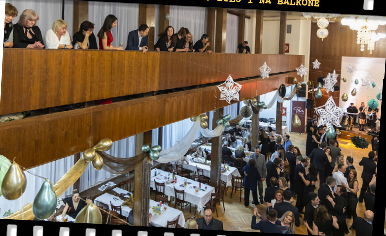
- PLNO BYLO I NA BALKÓNĚ