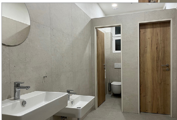
▶ WC v sokolovně – ženy