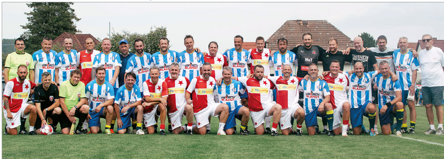
Legends Sázavy a Slavie.