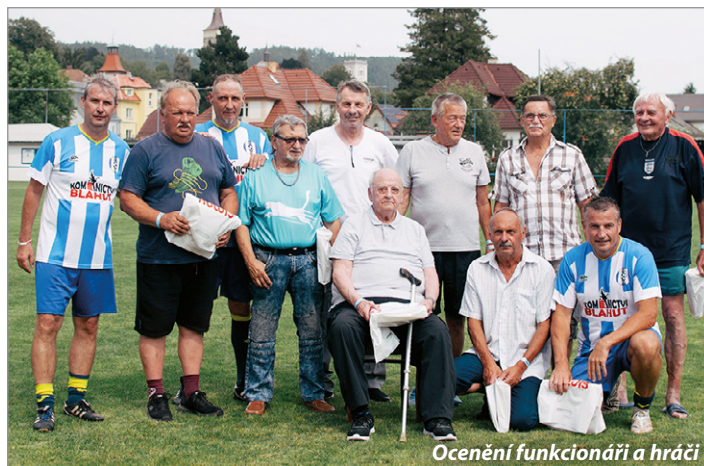
Ocenění funkcionářů a hráčů

a nemají prostor se přijít podívat do fotbalového areálu. Na fotbalových webových stránkách, zároveň Facebooku a Instagramu, budeme postupně zveřejňovat fotky a videa z celého dne, takže určitě doporučuji sledovat jeden ze zmíněných kanálů.“