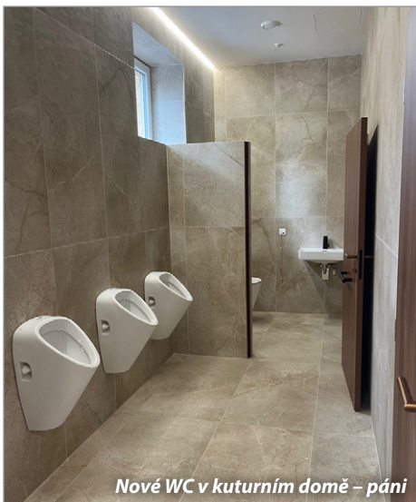
Nové WC v kuturním domě – páni