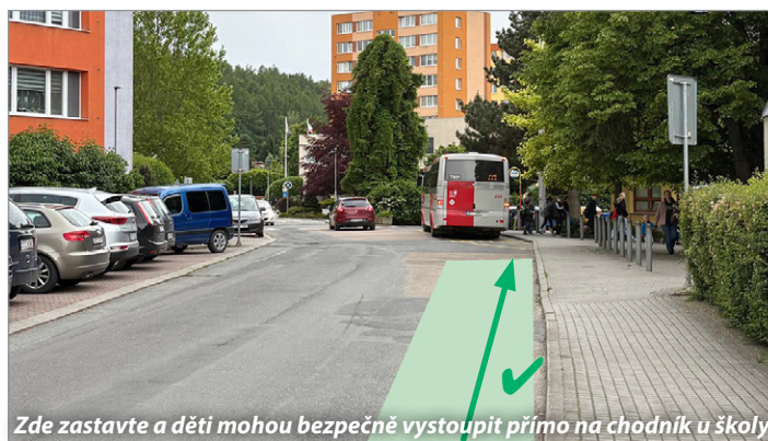
Zde zastavte a děti mohou bezpečně vystoupit přímo na chodník u školy