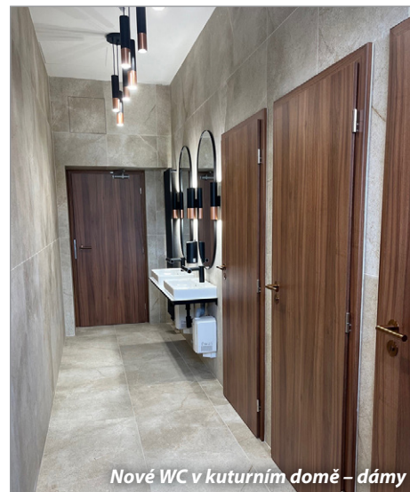
Nové WC v kuturním domě – dámy