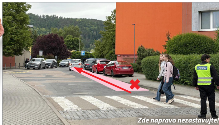
Zde napravo nezastavujte!