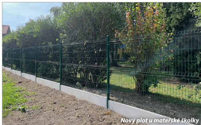
Nový plot u mateřské školky

Děkujeme a těšíme se na vaši další spolupráci! Za vedení města Radek Janda, radní