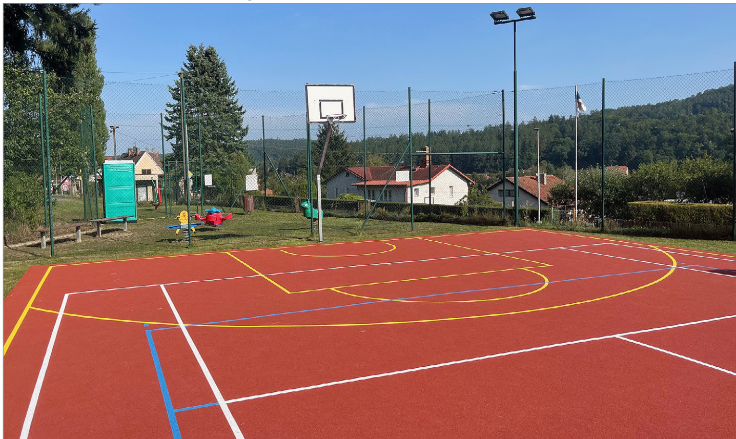
Nový povrch na hřišti v Černých Budech.