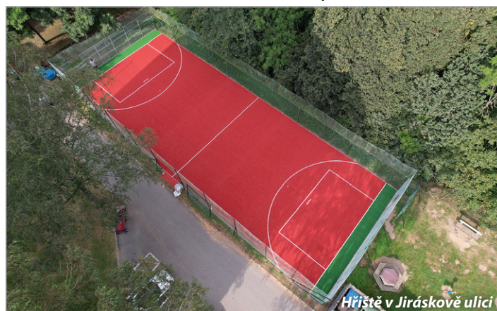
Hřiště v Jiráskově ulici

ZÁŘIJOVÉ VYDÁNÍ POUZE ELEKTRONICKY Říjnové tištěné pro občany Sázavy zdarma i do schránek