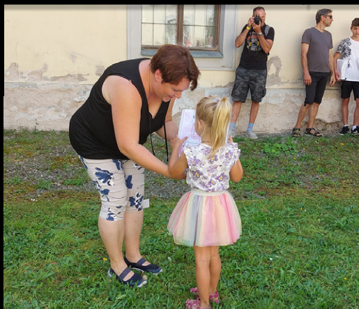
-PŘEDÁNÍ CEN ZA SOUTĚŽ