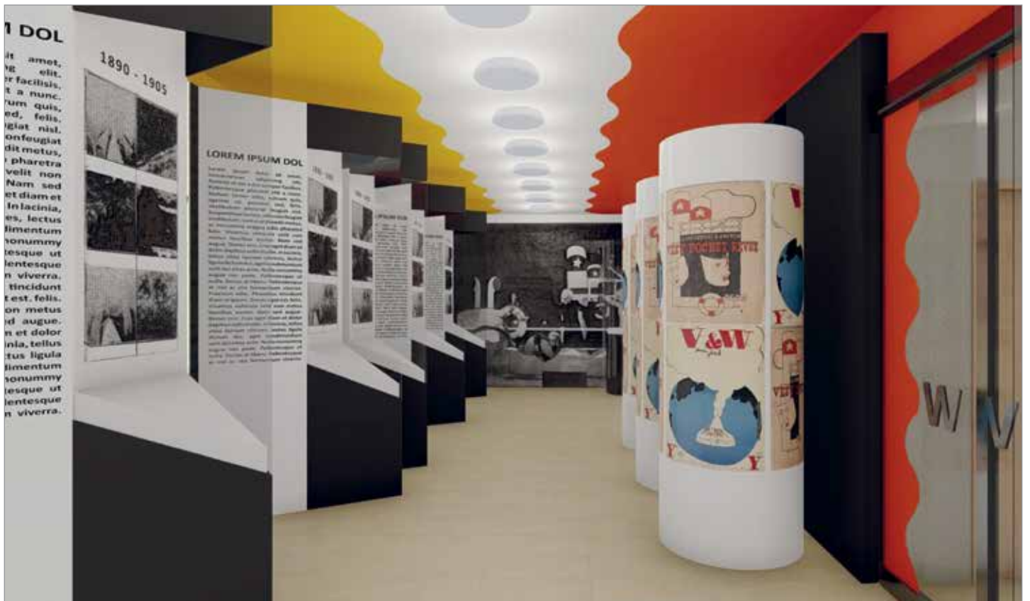
Pod rukama arch. Jana Špačka vzniká projekt Pamětní síně Jiřího Voskovce umístěné do sázavského informačního centra v kulturním domě na náměstí Voskovce a Wericha. Vzpomínka na nejslavnějšího sázavského rodáka chce reflektovat expresivní dobu, ve které Jiří Voskovec žil. Dynamické pojetí se projevuje i v celkovém barevném řešení, které vychází z dnes neobvyklého užití kombinace žluté a červené barvy, kterou známe z mnoha divadelních plakátů Osvobozeného divadla.